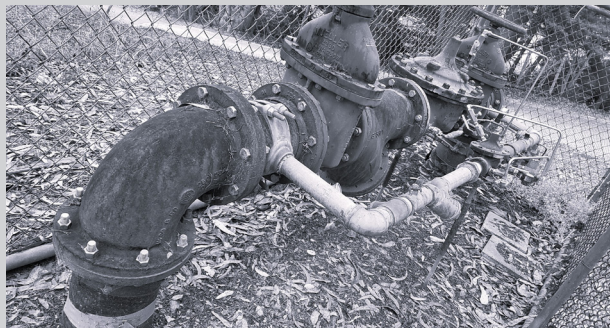
Estación de válvulas reductoras de presión

Mientras se realizaban las obras en el pozo de Alta Vista, también renovamos tres estaciones de válvulas reductoras de presión, las cuales son fundamentales para reducir y controlar la presión a medida que el agua potable fluye cuesta abajo desde nuestros tanques de almacenamiento